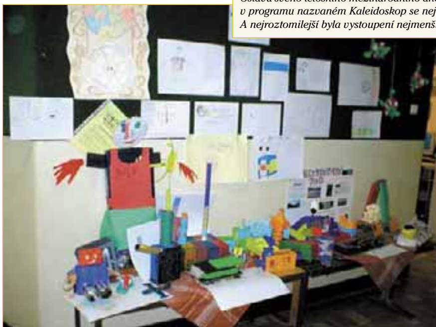
O ekologické nápady nemají děti napajedelských škol nouzi, přesvědčivě to dokázaly při letošní ekologické soutěži DDM.