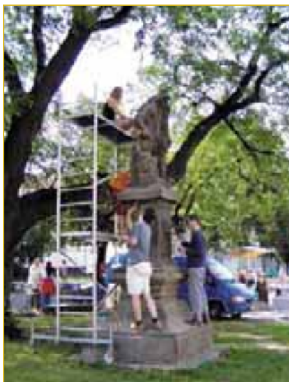
Svatý Floriánek na Masarykově náměstí: Odborná „kosmetika“ nejen ochrání, ale i zkrášlí tuto barokní památku.

Již podruhé se v Klášterní kapli uskutečnil koncert „SETKÁNÍ“. Sjedou se spolužáci konzervatoře, kteří dnes působí po celém světě, aby si spolu o prázdninách zahráli. Vše bude včas na plakátech, zatím jen termín koncertu - 9. srpna 2005 v 19 hodin.