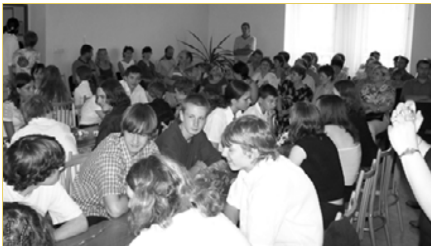
Slavnost vyřazení absolventů Základní umělecké školy R. Firkušného.