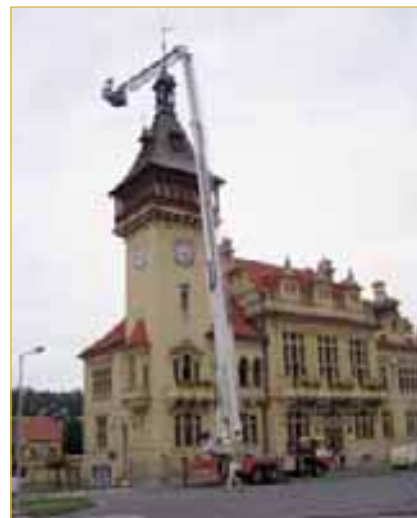
◀♦ Za pomoci hasičské plošiny byla vyměněna střecha na radnici. Foto: J. Souček

Do doby než bude vybudováno pevné přístaviště, instalovali pracovníci Technických služeb ve spolupráci s panem Hampalou, provozovatelem plavby ve Sptyhněvi, přístaviště plovoucí. Umístěno je na Nábřeží u bloku 1. Loď bude jezdit o víkendech mezi Napajedly a Sptyhněví. Text a foto J. Souček