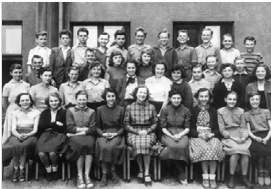
V předcházejícím vydání novin jsme zvali na setkání bývalé spolužáky narozené v roce 1943. A jen pro zajímavost - takoví byli a takoví jsou dnes.

Poradenská linka SOS po telefonu 900 08 08 08 (dotovaná cena 8 Kč/min), www.spotrebitele.info