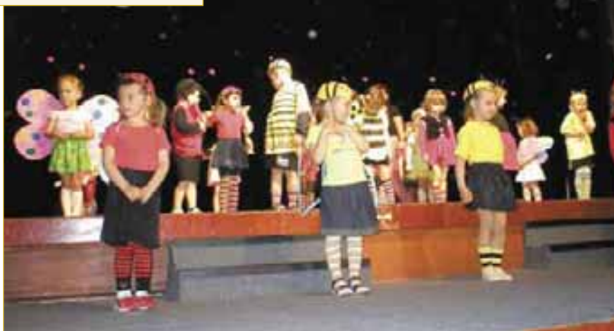
Oslavu svého letošního mezinárodního dne spojily děti z MDD se svátkem svých maminek a v programu nazvaném Kaleidoskop se nejen pobavily, ale předvedly také, co všechno umí. A nejroztomilejší byla vystoupení nejmenších.

Letos zjara se zúčastnily Velké ekologické soutěže vynálezců, ve které šlo o to zhotovit z recyklovaných materiálů výrobek prospěšný přírodě a životnímu prostředí. Děti přihlásily do soutěže 31 zajímavých exponátů. Všechny výrobky byly velmi originální a nápadité. Odborná porota z odboru životního prostředí Městského úřadu neměla při výběru tří nejlepších vůbec snadnou práci. Nakonec se rozhodla pro „Čistič mořského dna“ a je-