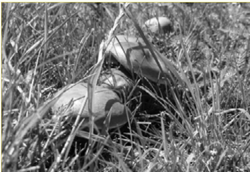
Hříby rostou nejen v lesích, ale i v parku Na Kapli.