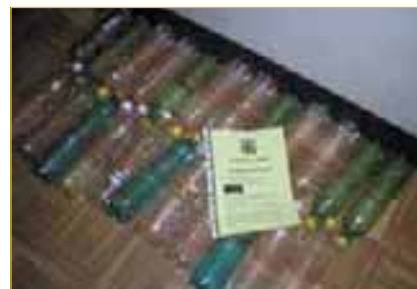
Lehátko z PET lahví bylo oceněno v soutěži DDM jako výrobek nejšetrnější k přírodě a životnímu prostředí