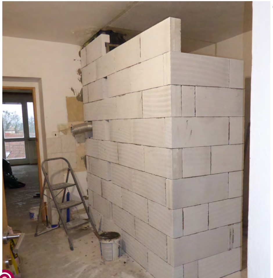
Základem modernizace každé z bytových jednotek v Domě s pečovatelskou službou Pod Kalvárií je výstavba zděného jádra.

Předmětem další rozsáhlé investice města je vybudování nových volejbalových kurtů ve východní části areálu základních škol. Na ploše bývalého škvárového hřiště zde bude umístěna sestava dvou kurtů na klasický volejbal a jednoho kurtu na volejbal plážový. Potřebné venkovní příslušenství zajistí výstavba skladu antuky a prostoru určeného k uskladnění techniky pro údržbu kurtů. Dešťové vody z nově vybudovaných ploch, z přístřešku i z drenáže volejbalových hřišť budou svedeny do jímky a dále využívány ke kropení antukových kurtů. Moderní provozní a hygienické zázemí sportovců bude umístěno v přilehlém, dlouhodobě nevyužívaném objektu kotelny 2. základní školy. Bez nutnosti měnit vnější rozměry stavby zde bude zřízen kancelář