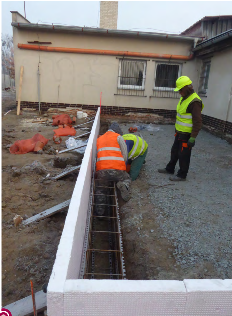
V areálu fotbalového hřiště probíhá výstavba nového hygienického zázemí.