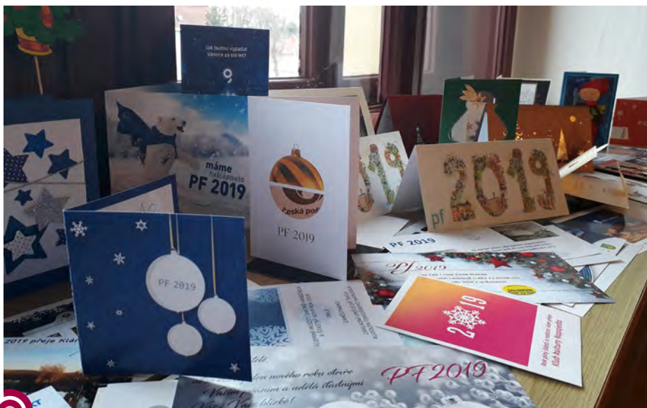
Město Napajedla dorazily desítky novoročenek s přáním do nového roku.